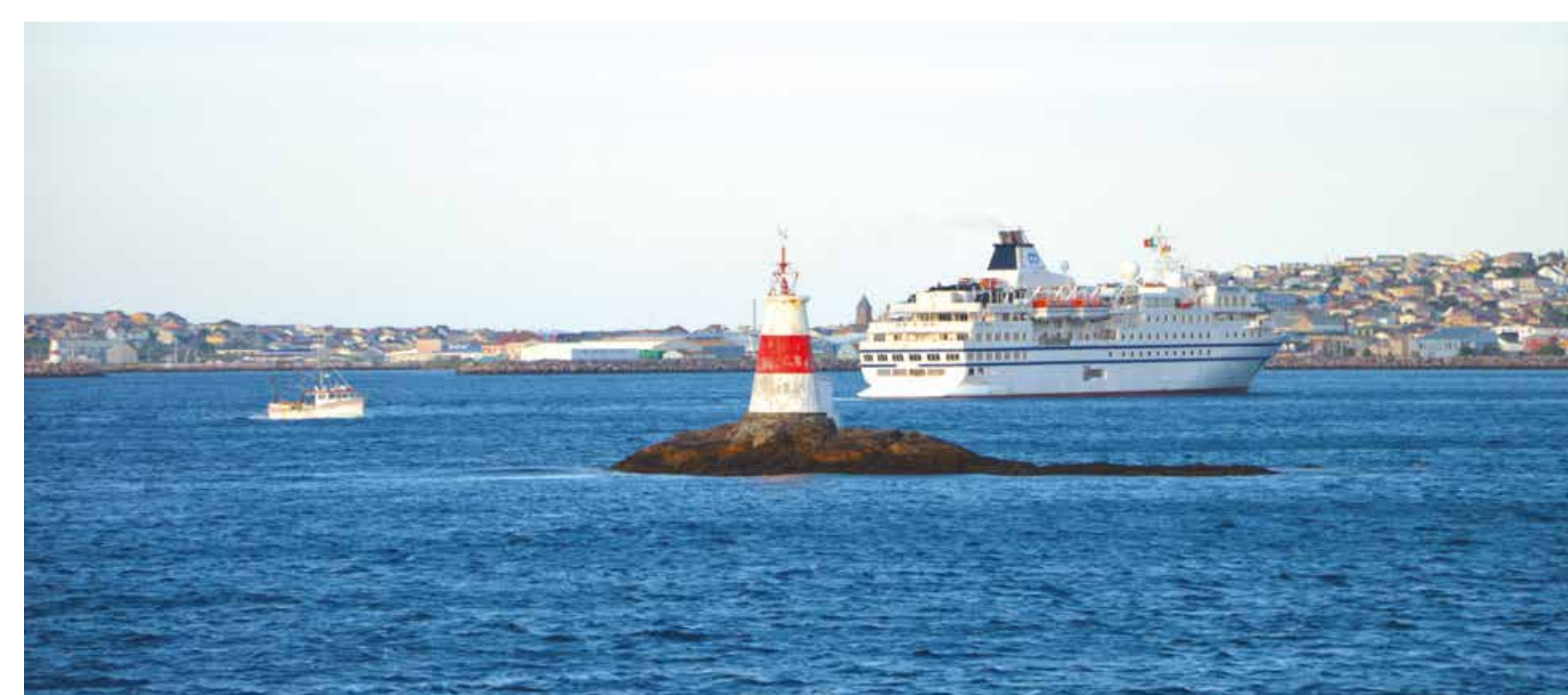
Pêche et croisière devant Saint-Pierre