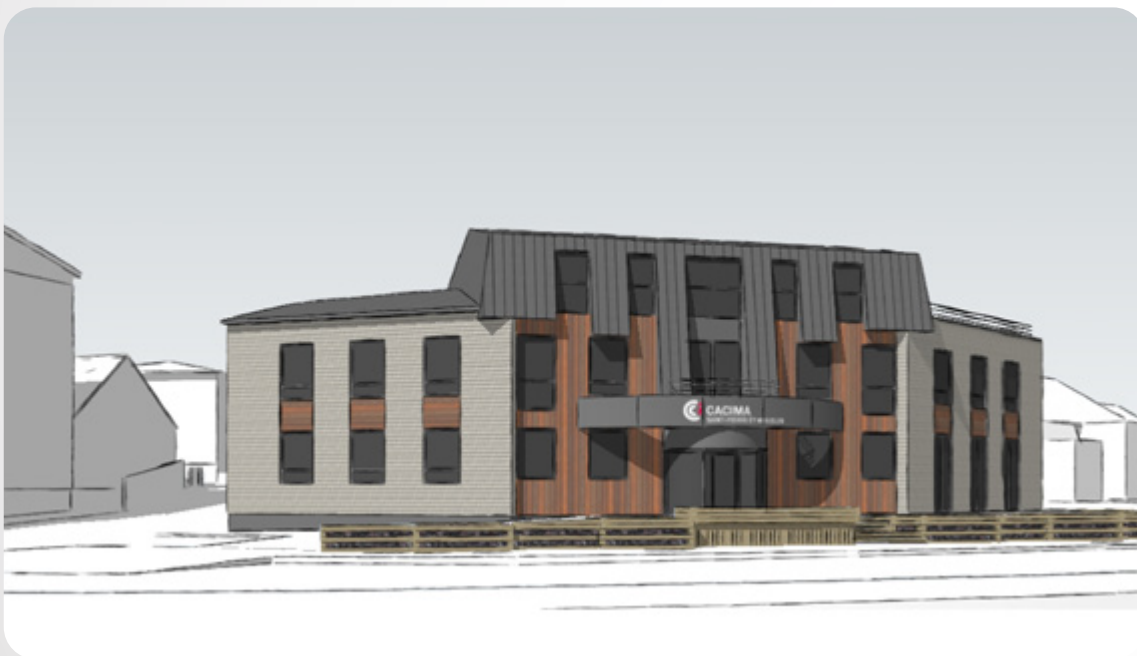
Vue piétonne depuis le boulevard Constant Colmay.