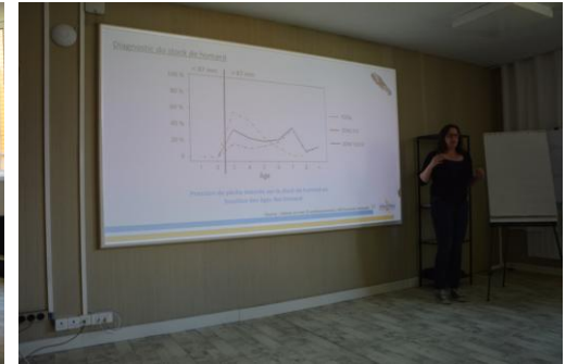
Evaluation du stock de homard de l'archipel de Saint-Pierre et Miquelon : embarquements

• Réflexion collective sur deux thèmes le 18 juillet à St-Pierre: 23 participants représentants des secteurs de la pêche, du tourisme, de la collectivité territoriale et de l'Etat