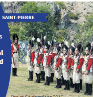
Projet Célébrations 2016

Commémorations de l'Armistice Visite du Royal Newfoundland Regiment Centenaire de la Bataille de la Somme.